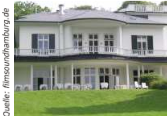
Das Elsa Brandström Haus in Blankenese bot den edlen Rahmen für FilmSoundHamburg